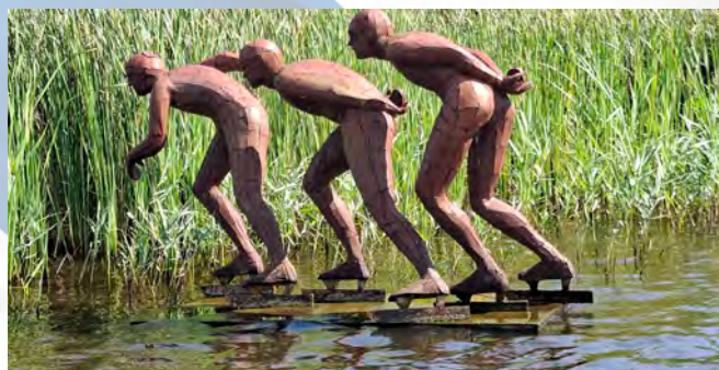
Schaatsers in Eernewoude

Op deze eerste dag gaan we richting Waddenzee. We rijden via het mooie Beetsterzwaag naar Drachten en via Buitenpost naar het Lauwersmeer: een bijzonder stukje Friesland. We zien de waterbouwkundige kunstwerken en het overweldigende natuurschoon van dit gebied. Dan buigen we af naar Dokkum en komen vervolgens in Leeuwarden. Daar nemen we de tijd voor een rondvaart door de grachten en misschien nog voor andere toeristische bezienswaardigheden of een drankje op een terras aan een van de gezellige grachten. De dag zal dan al een heel eind zijn gevorderd en dus gaan we weer richting Oranjewoud, waar gezelligheid in de bar of op het terras en daarna een heerlijk diner op ons wacht.